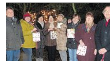
Die Arbeiterwohlfahrt war auf Geschenketour.